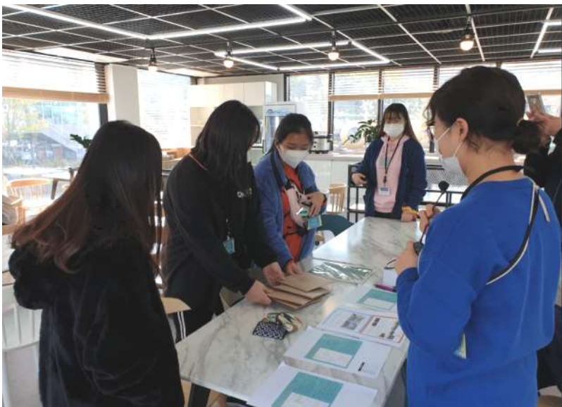
◀ 청소년 교육 프로그램