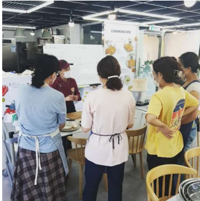
떡제조기능사 과정 ▶