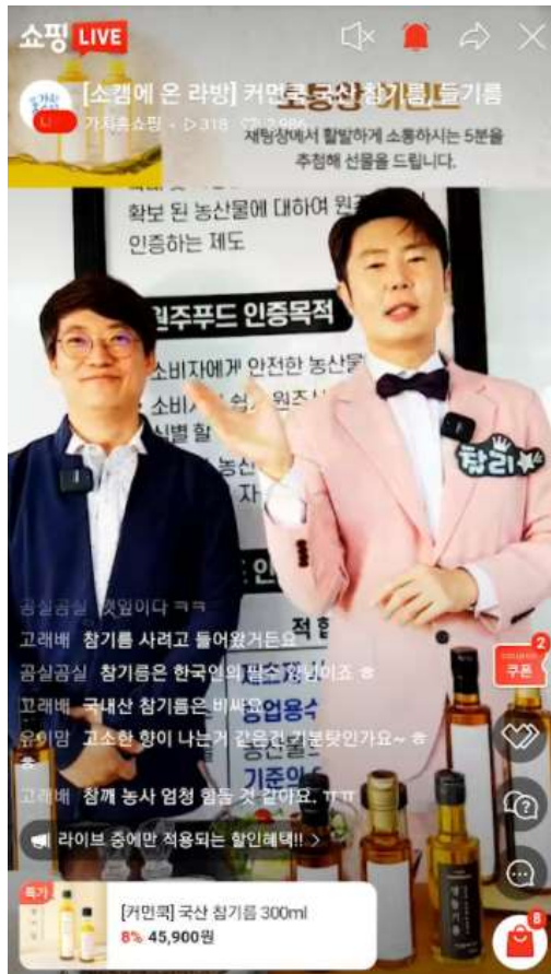
◀ 쇼핑몰 운영(라이브커머스 사진)