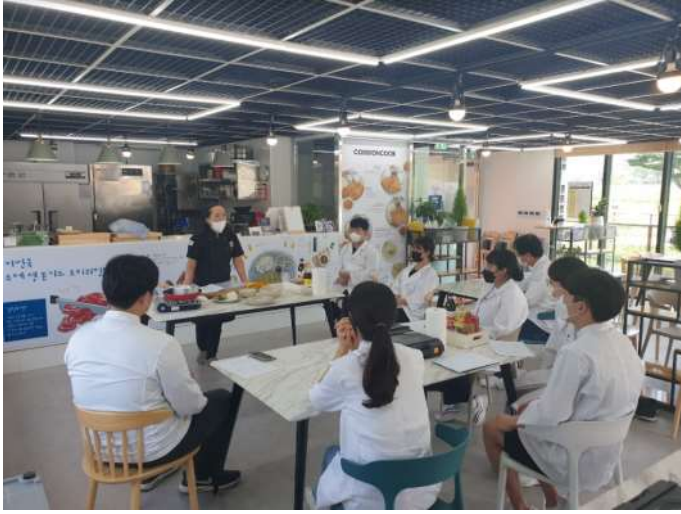
◀ 한식조리기능사 과정