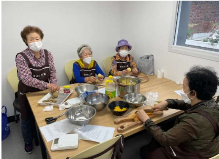
◀ 어르신 소셜다이닝 프로그램