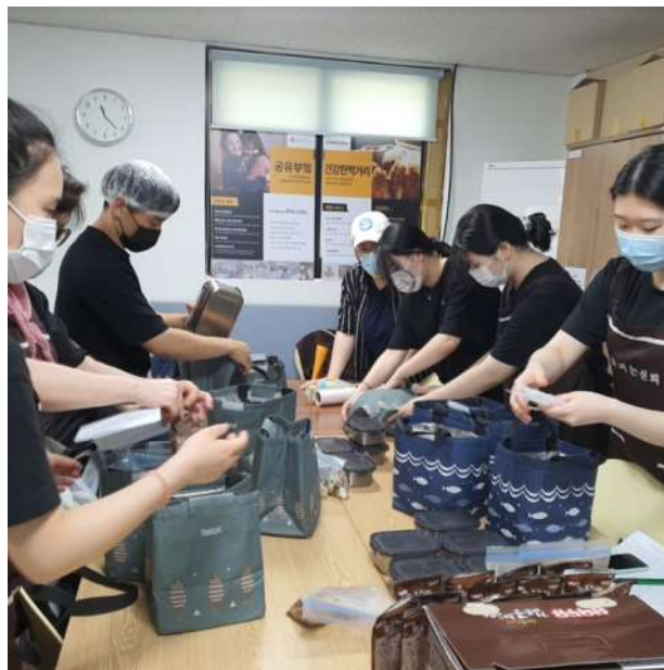
요리봉사단 운영 ▶