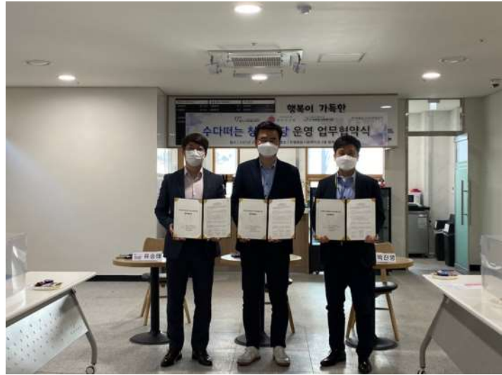
청년 소셜다이닝 식당 운영 ▶