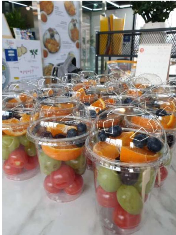
레스토랑 운영(단체도시락 등) ▶